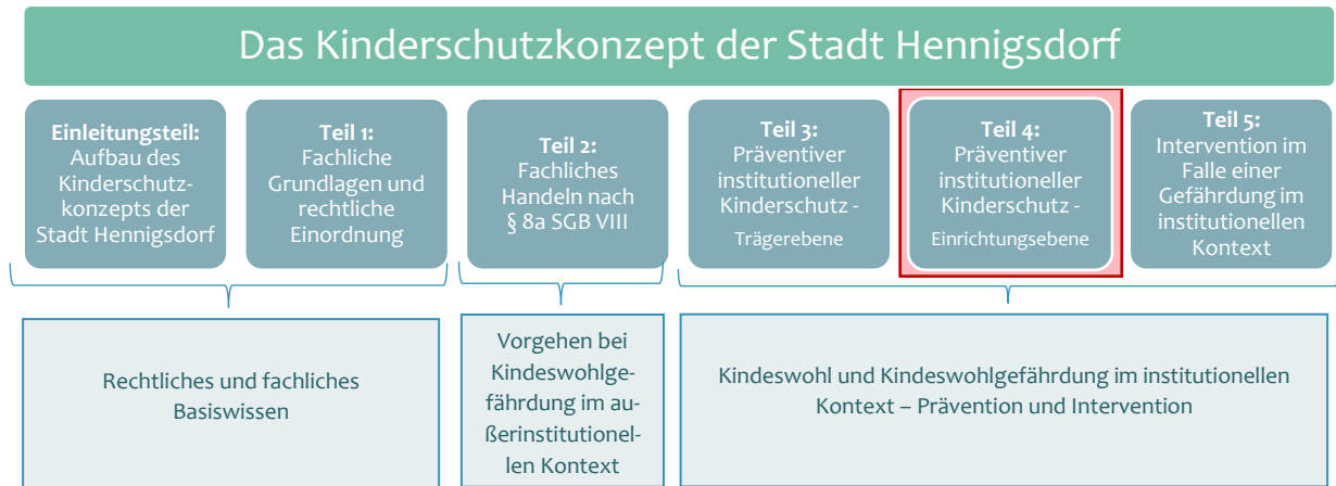
Abbildung 1: Aufbau und Inhalte des Kinderschutzkonzepts der Stadt Hennigsdorf

Träger von erlaubnispflichtigen Einrichtungen der Kinder- und Jugendhilfe in der Bundesrepublik Deutschland müssen nach § 45 SGB VIII den Schutz ihrer Kinder vor Gewalt und Übergriffen einrichtungsspezifisch prüfen und einen sicheren Ort des Aufwachsens gewährleisten . Neben den in Hennigsdorf geltenden Schutzmaßnahmen auf Trägerebene (Teil 3), beinhaltet der vorliegende Teil 4 nun präventive Schutzmaßnahmen auf Einrichtungsebene (s. Abb. 1).